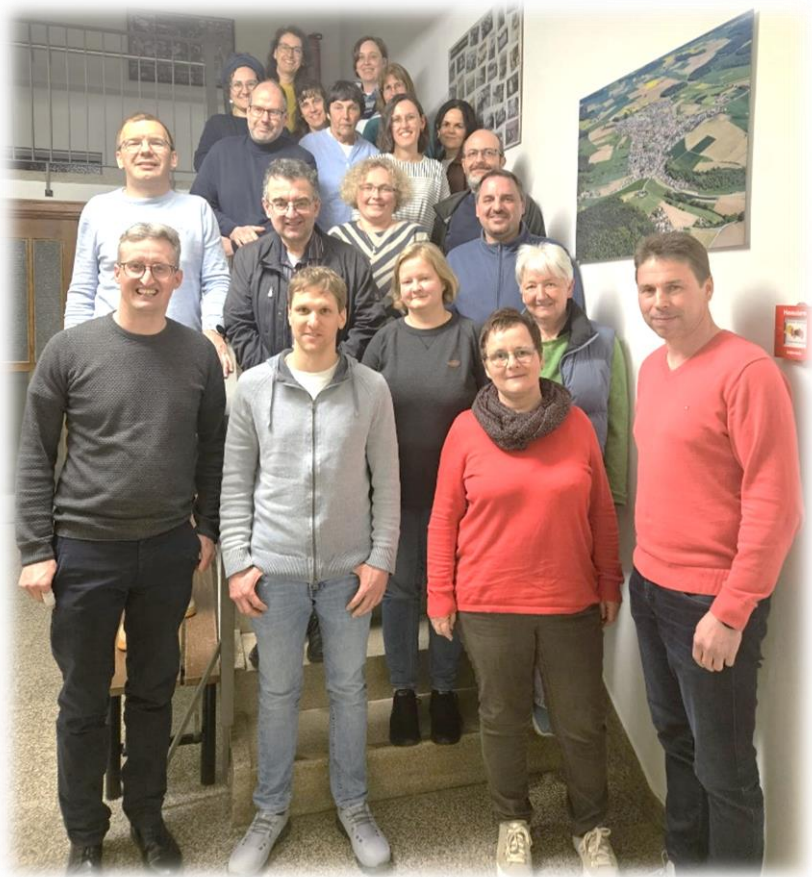
Der neue Pfarrgemeinderat